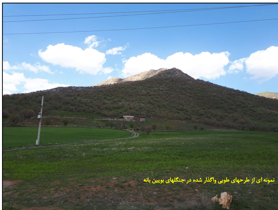
نمونه ای از طرحهای طوبی واگذار شده در جنگلهای بویین بانه